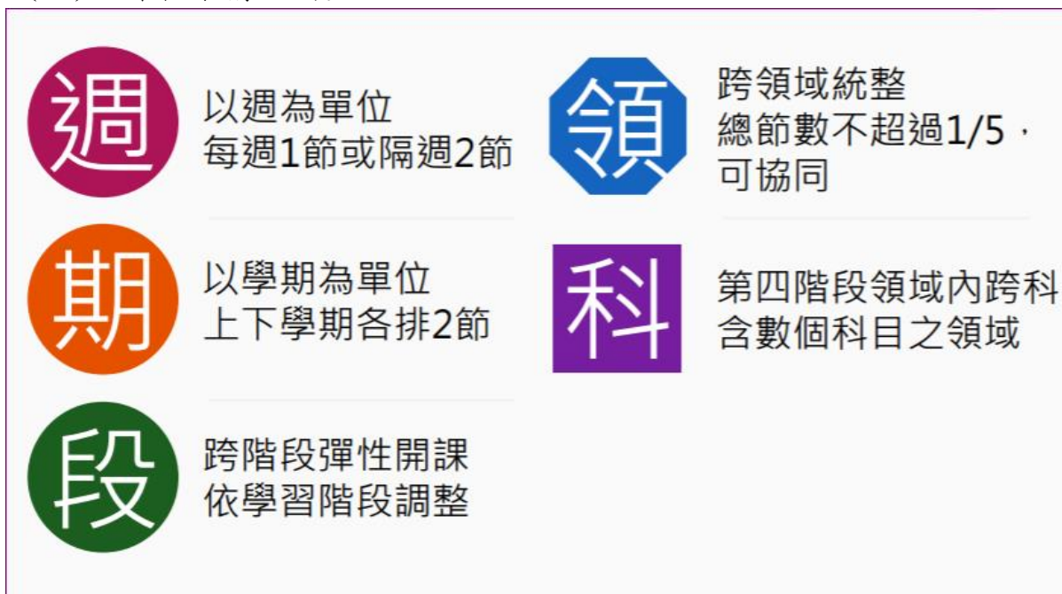
圖三 12年國教課程架構說明