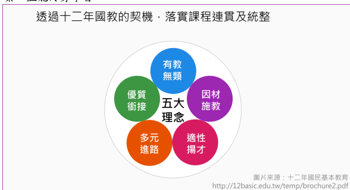
圖一 12 年國教課程願景發展歷程